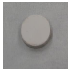
加圧成型及び焼成