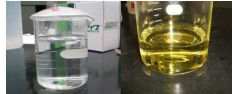
金属イオンの水溶液

目的となる試料の金属イオンを含む水溶液を作製する。これら水溶液を混合し、クエン酸・エチレンジアミンを加えて加熱。