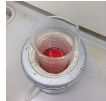
マントルヒーターに入れ加熱