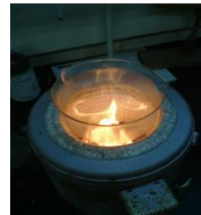
炎が上がることも...